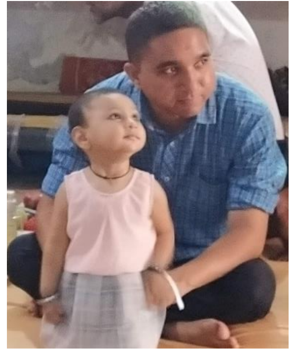
વક્ષ્ય સુધી પહોચવા માટેની સમાન 'નજર'

પ્રભાત એજ્યુકેશન ફાઉન્ડેશન સંસ્થા કે જે 2003થી અમદાવાદના વંચિત વર્ગના વિશિષ્ટ જરૂરિયાત ધરાવતા બાળકો / વ્યક્તિઓ સાથે કાર્ય કરે છે. સંસ્થા વિશિષ્ટ જરૂરિયાત ધરાવતા બાળકો અને પુખ્તવયના લોકોના માનસિક અને શારીરિક પડકારોમાં મદદ કરે છે. સંસ્થા 3 પ્રોગ્રામ દ્વારા કાર્ય કરે છે. - પ્રભાત સેન્ટર, સમુદાય આધારિત પુનર્વસન અને એડવોકેસી દ્વારા નેટવર્કિંગ પ્રભાત એક બાળક સાથે પહેલા કામ શરુ કર્યું હતું અને આજે તેનો વિકાસ અમદાવાદમાં વિશિષ્ટ જરૂરિયાત ધરાવતા 3000થી વધુ વ્યક્તિઓ તેમજ તેમના પરિવારો, પાડોશીઓ અને સમુદાયોને સ્પર્શે છે.