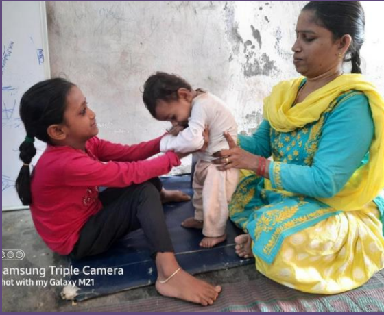
‘પ્રો’ જેવી સર્વિસની પણ સેવાઓ ઉપલબ્ધ