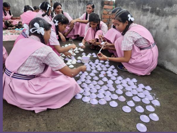
દિવડા બનવવામાં અમારીય ભાગીદારી !