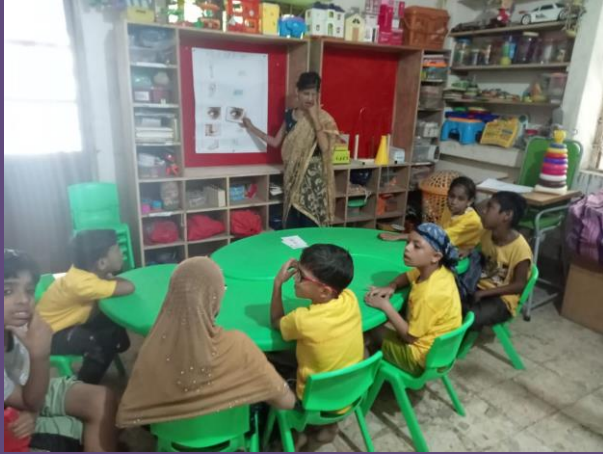
મળો ! નાના શિક્ષકને