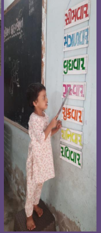
શીખવવાની પદ્ધતિની એક આ પણ રીત