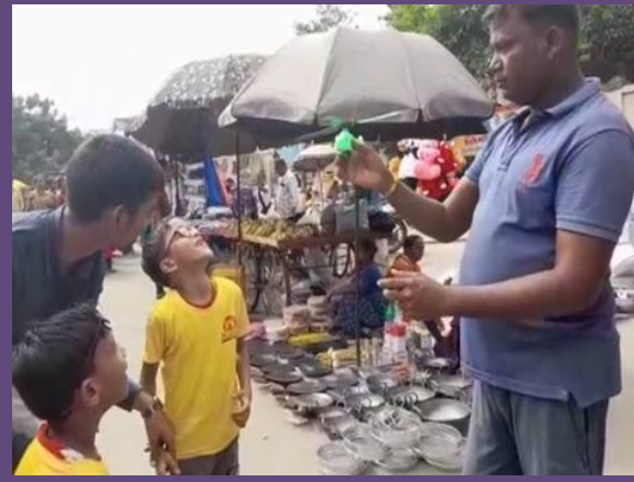
આનંદમેળામાં રંગબેરંગી આનંદ અનુભવતા બાળકો