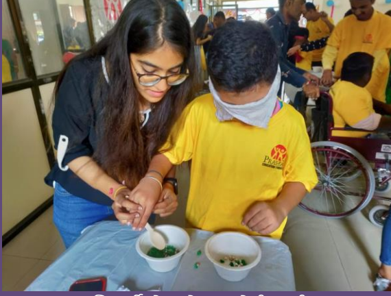
GLS વિદ્યાર્થીઓ સાથે બાળકોની મસ્તી