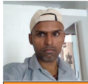
14 th August, નિકુલ

"બાર બાર દિન યે આયે, તુમ જીઓ હજારો સાલ, સાલ કે દિન હો હજાર હેપ્પી બર્થ ડે ટૂ યુ હેપ્પી બર્થ ડે ટૂ યુ." પ્રભાત ટીમની જન્મદિન નિમિત્તે ખૂબ-ખૂબ શુભેચ્છા!