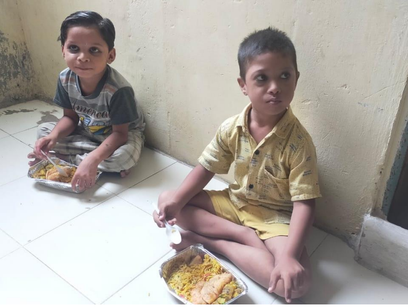
ઈદ પર બાળકોને જમાડવામાં આવ્યા