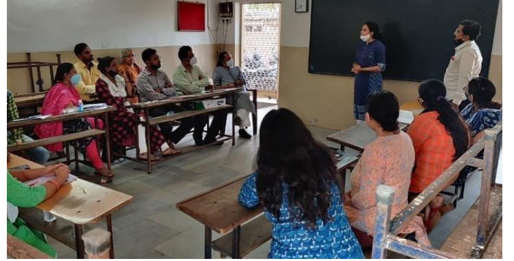
સંસ્થાની ટીમ મીટીંગ