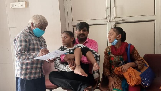
મેડીકલ સિટીફિકેટ માટેનું એસેસમેન્ટ