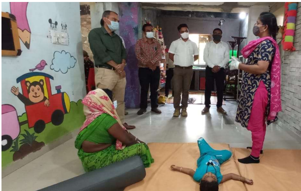
C.R.C. દ્વારા મુલાકાત