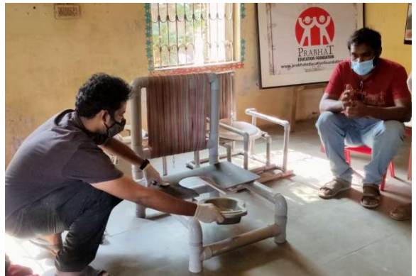
N.I.D. સ્ટુડન્ટની ટોચલેટ ડિઝાઈન

Address: A-4, Sujal Apartment, Opp. Satellite Bungalows, Ramdevnagar, Ahmedabad.