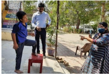
ડો. જૈની દ્વારા ફિઝિયોથેરાપી