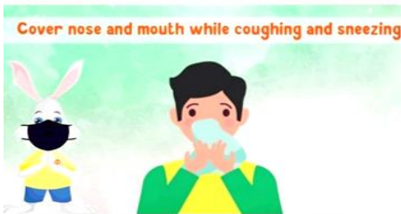
ખાંસતે અને ઊંકતે સમયે નાક અને મુંઢ ઢંકે। હમને જિમ્મોદાર બનકર અને નિયમો કા પાલન કરકર COVID-19 સે બચકર સુરક્ષિત રહેના હૈ।