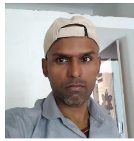
14 th August, નિકુલભાઈ