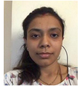
25 th August, હિન્નલ