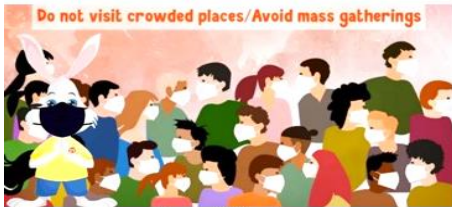
મીઠું-મીઠુંવાળી જગ્યા પર જાને સે બચે।

हैलो मित्रों, मैं आप लोगों से मिलने के लिए फिर से आ गया हूँ। आपका गट्टू आपसे कुछ कोरोना से लगती बाते बताएगा, जिसका आप लोगोंको ख्याल रखना है।