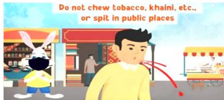
સાર્વજનિક સ્થાનો પર તંબાકૂ, ગુટલા ન ચબાવે અને ન ધૂંકે।