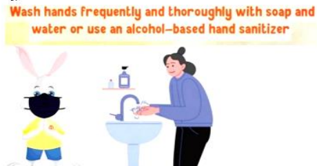
સાબુન અને પાની સે બાર-બાર અને અઢકી તરહ સે હાથ ધોવે યા અલ્કોહલ-આધારિત હૈંડ સેનિટાઇઝર કા ઉપયોગ કરે।