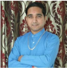
27 th July, મનીષભાઈ