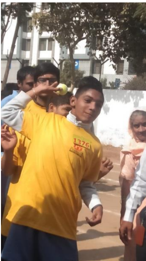
જીતીશ તો હું જ!