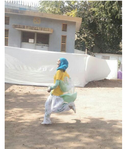
ભાગ ફોજીયા ભાગ