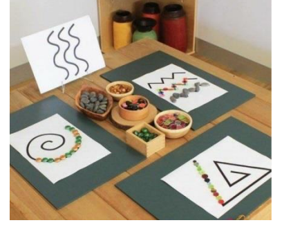
જ્ઞાન સાથે ગમ્મત