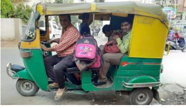
રીક્ષામાં બેસી ચાલ્યા અમે!