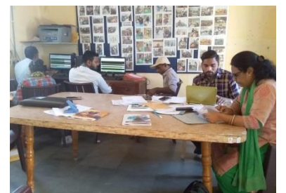
વર્ક ઈસ પ્રોગ્રેસ