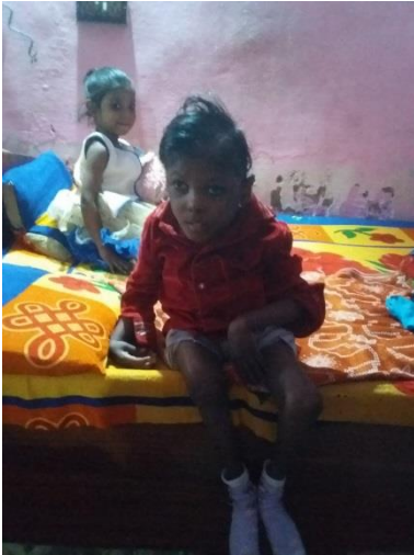
હું જાતે બેઠો છું