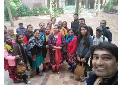
“અમારી ટુકડી ઝીંદાબાદ”