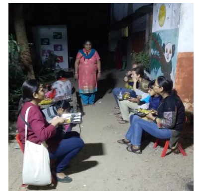
શાંતિથી જમજો બધાં