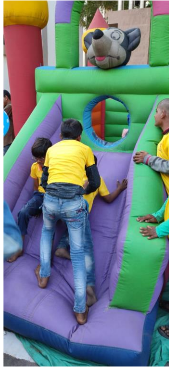
કુદવાની તો મજ પડી ગઈ!