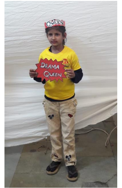
હું છું એવોર્ડ વિજેતા