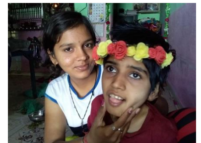
એક હજારો મેં મેરી બહેના હૈ