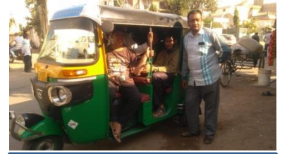
સાજીદ અંકલ ચાલો ને!