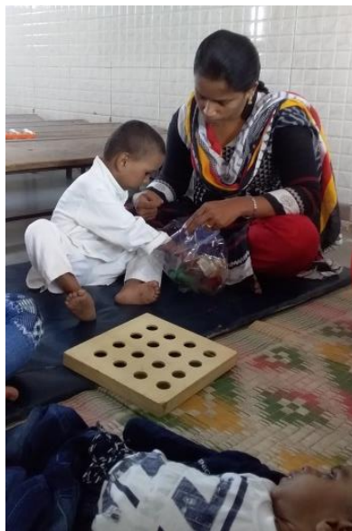
હું જાને શોધીશ.