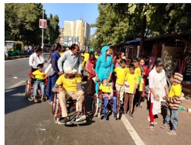
મોબાઈલ કરતા સ્માર્ટ સ્ટ્રીટ