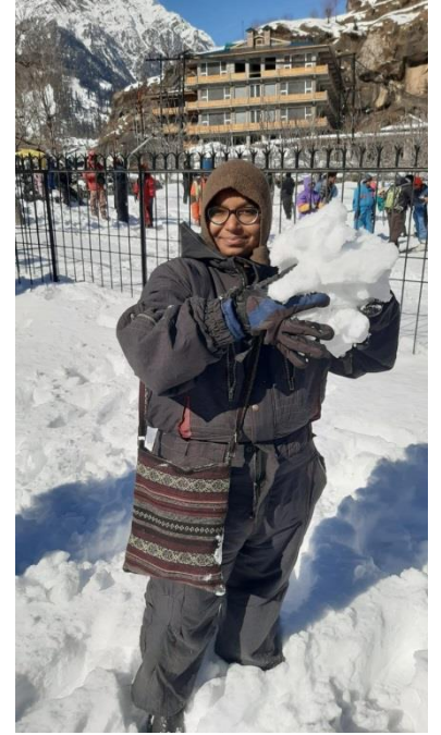
ઠંડી કી તો ઐસી કી તૈસી