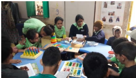
યે દોસ્તી હમ નહીં છોડેંગે!