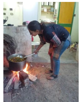
ખીચડી પક ગઈ ક્યાં?