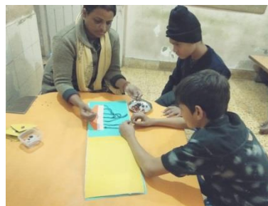
આપણે સરસ બનાવ્યું નહીં?