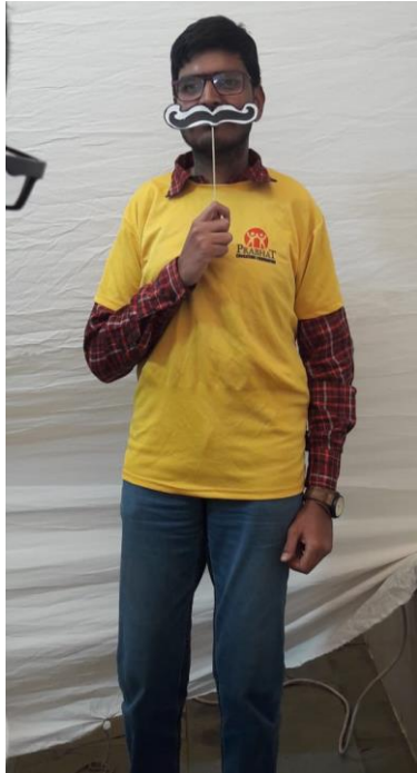
મુંછે હો તો આદિલ જેસી!